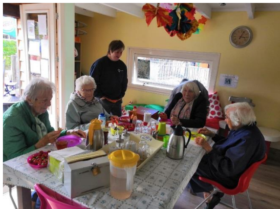
Gezelligheid in het theehuis